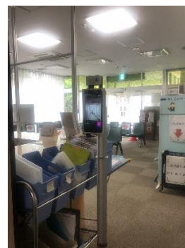
総合健診センター受付