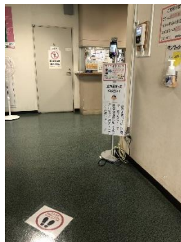
救急・夜間出入口