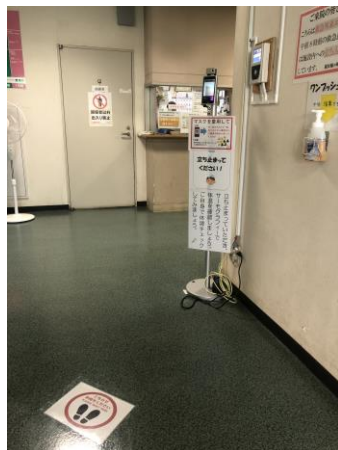
救急・夜間出入口