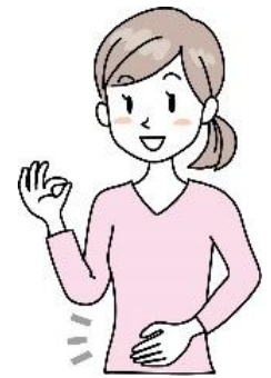
消化器・一般外科

また、毎週金曜日午前の外科外来は消化器・一般外科が専門の女性医師が担当しており、便秘に関するご相談も多くご受診いただいております。お悩みの方はお気軽にご相談下さい。